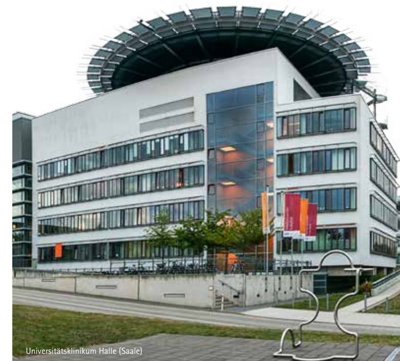
Universitätsklinikum Halle (Saale)

26. und 27. Oktober 2018 Universitätsklinikum Halle (Saale)